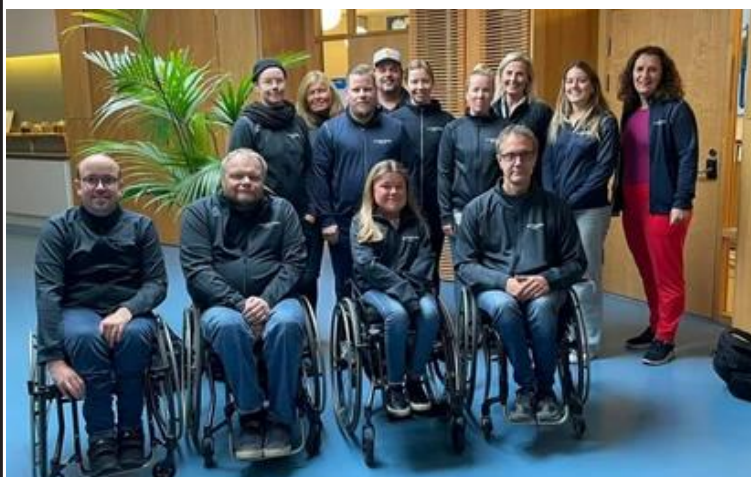
Några av oss som utbildar

Är ni intresserade av denna utbildning så hör av er till Smålands Parasportsförbund 070-88 50 490. Ewa