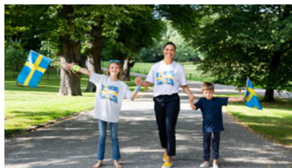
Kronprinsessan Victoria, Prinsessan Estelle och Prins Oscar lyckönskade de svenska paraidrottarna inför Paralympics 2021.